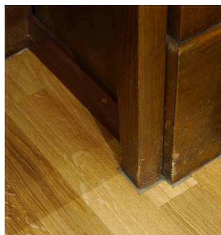
Pfarrstube in der Erlach-Ligerz Kapelle 20.210.311. Rechts Detail vor und nach dem Schleifen und Ölen des neuzeitlichen Parketts.