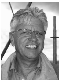
Häberli Hermann Architekt ETH SIA, Münsterarchitekt