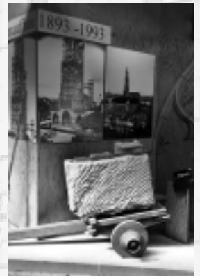
Schausteinhausen in der Sommerhütte