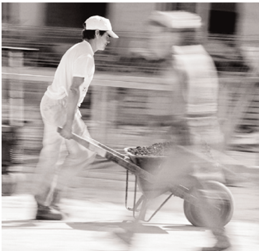
Billigere Arbeitskräfte wegen erweiterter Personenfreizügigkeit?