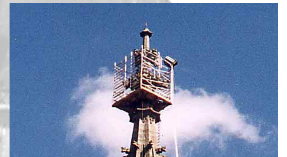
Erneuerung Sicherung der grossen Kreuzblume, Fugensanierung

Aufbau Schadens- kartierung, Mass- nahmenpläne nach Dringlichkeit, etc.