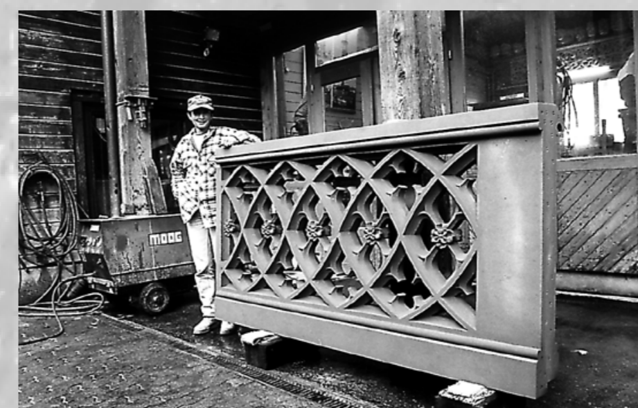
Ein Werkstück der dreiteiligen Masswerkbrüstung versetzbereit

Weitere Arbeiten: Turmhalle, Orgellettnerfront: